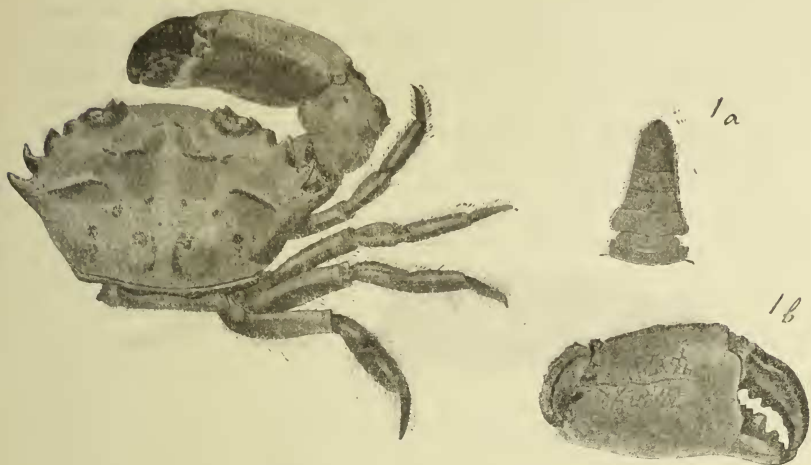
Fig. 1. — Heteropanope africana de Man; le front étant cassé, son bord antérieur a été indiqué par une ligne droite pointillée.

Comme le prouvent les dimensions, la largeur relative de la carapace augmente un peu avec l'âge, tandis que la largeur du front et la distance des angles extraorbitaires diminuent légèrement.